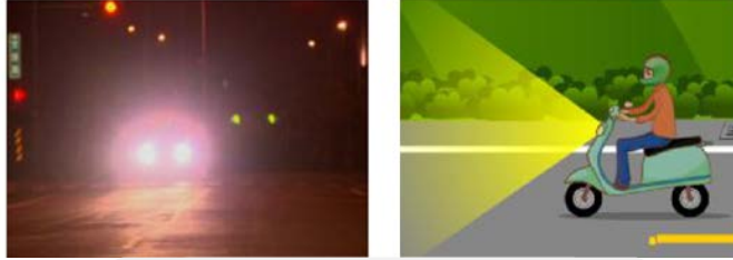
夜間會車時勿開遠光燈

從同理心來想，機車駕駛人也不可以任意改裝高亮度的頭燈，以免影響道路上其他駕駛人的眼睛。